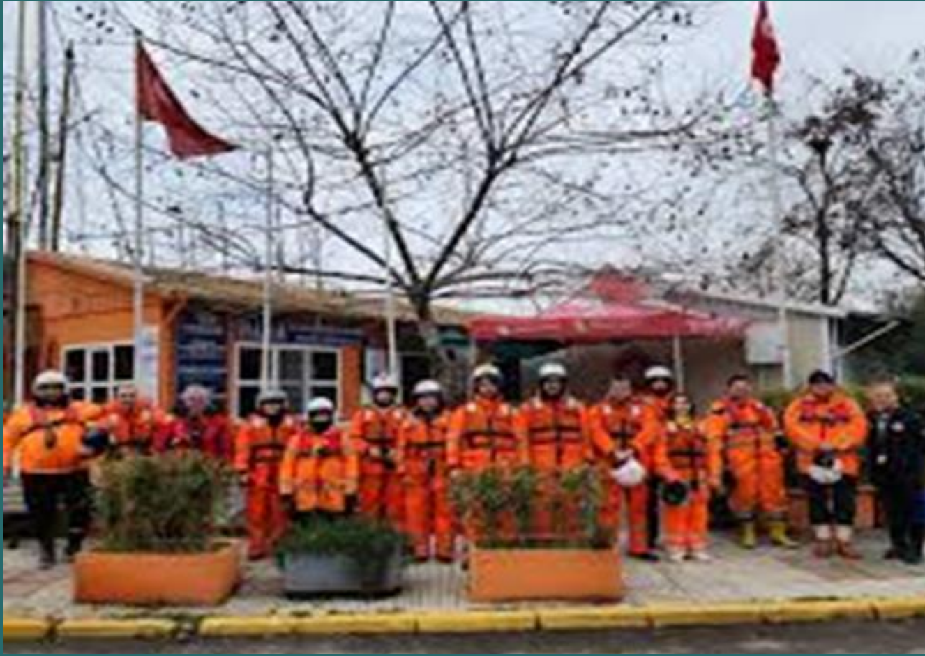
İstasyon önünde yeni dönem gönüllü adayları