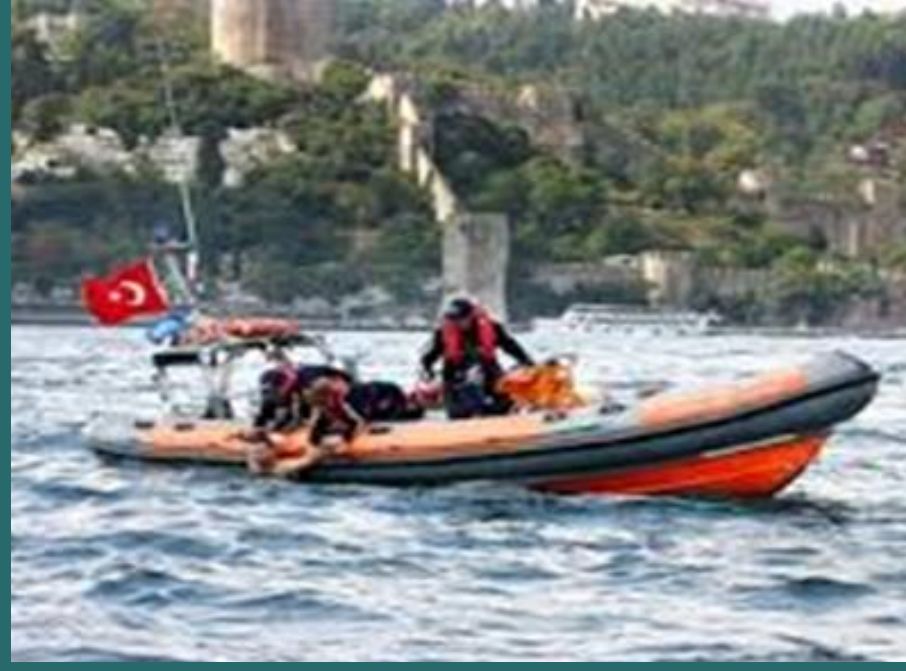
212 Numaralı özel kurtarma botu