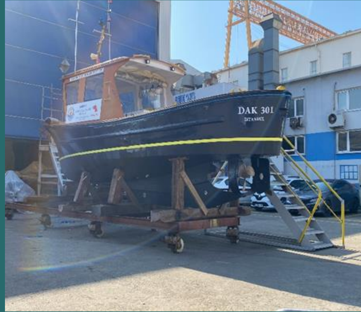
401 numaralı bot revizyonu ile RMK tersanesinde bakım onarımda olan 301 numaralı bot