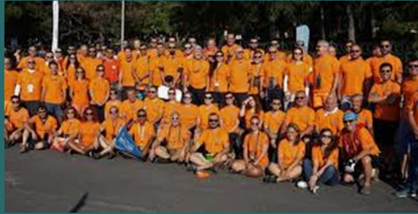
TMOK Boğaziçi yarışında görevli ekibimiz

Pandemi öncesi 7/24 görev yaparken sonrası ve kış aylarında vardiyaları sadece (cuma dahil) haftasonları organize ediyoruz.