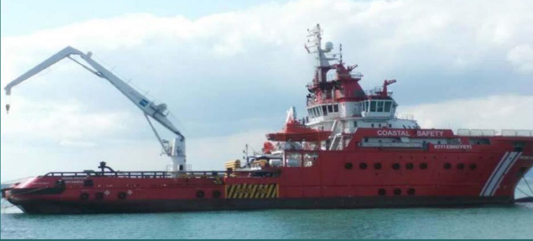
Nene Hatun Kurtarma Gemisi