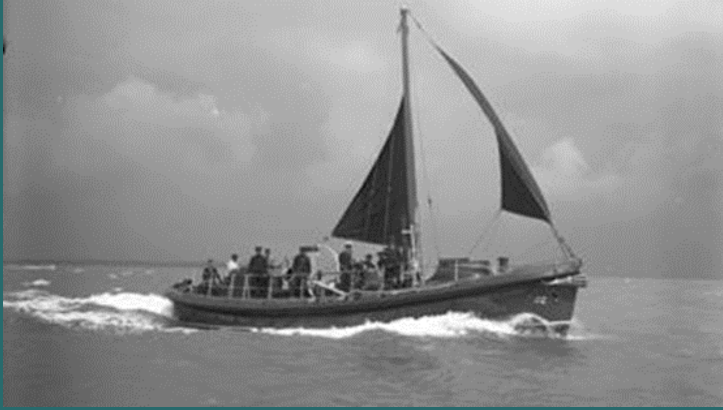
RNLI tarafından kullanılan ilk teknelere ait resimler