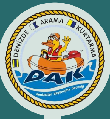
Hızlı müdahale botu