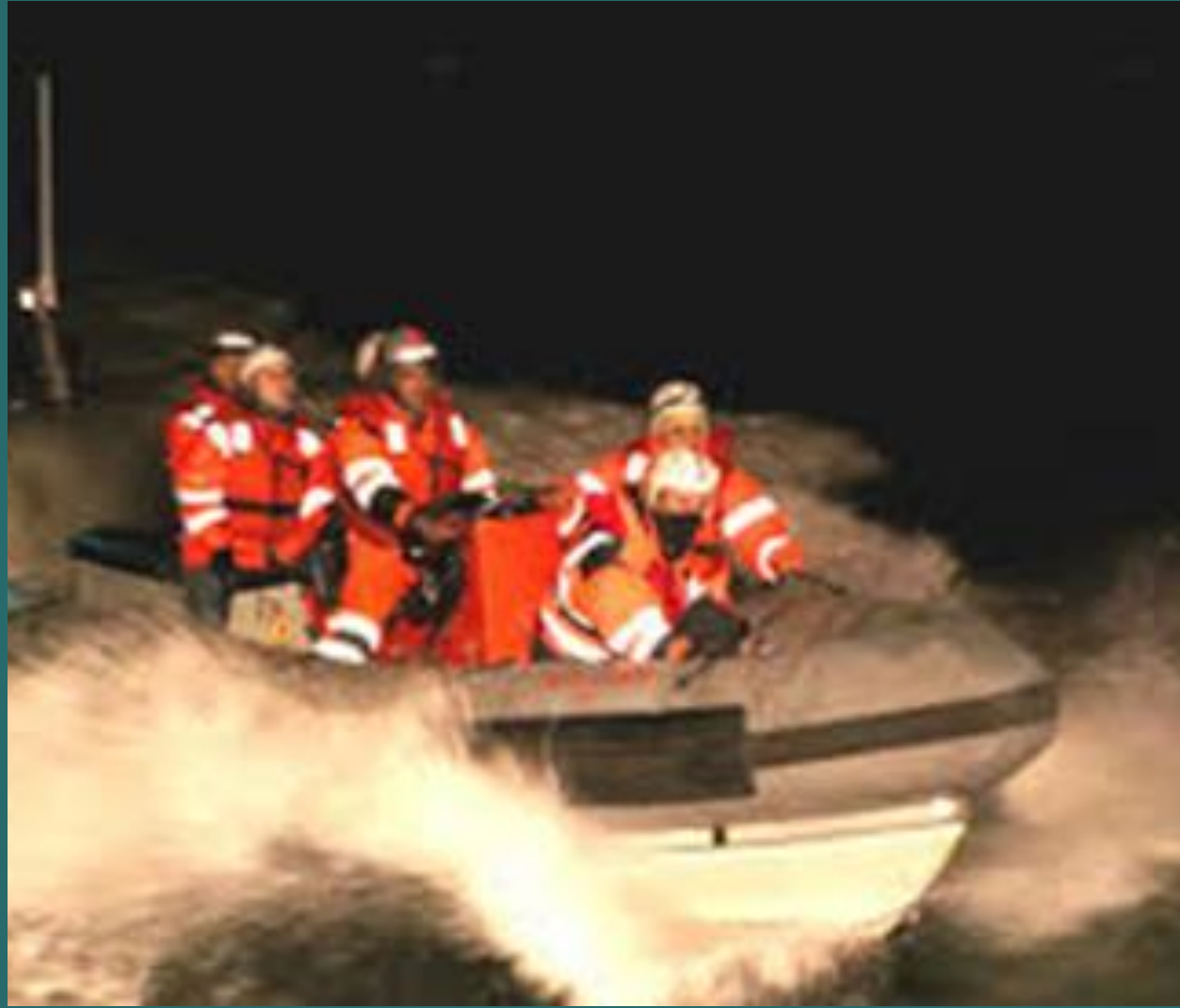
402 Numaralı kurtarma botu