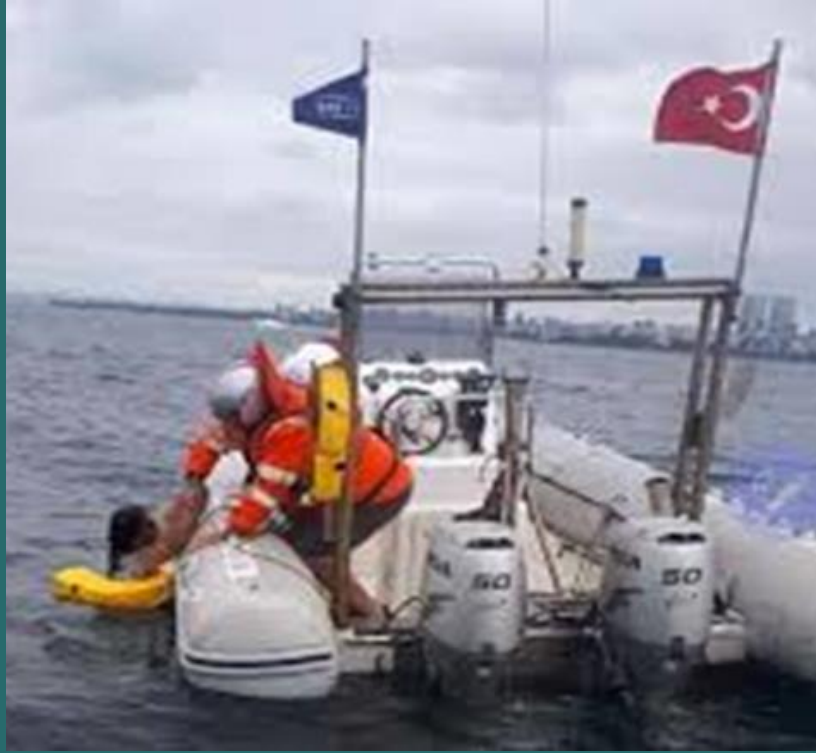
Yaklaşık 1.5 mil açıkta , 201 numaralı destek botu ile kurtarılan sorunlu vatandaş