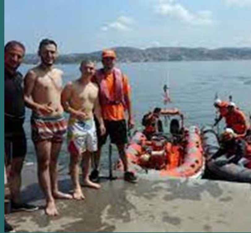
Yeniköy'de Suyun 4 metre altında yarı boğulmuş durumdayken tarafımızdan kurtarılan genç