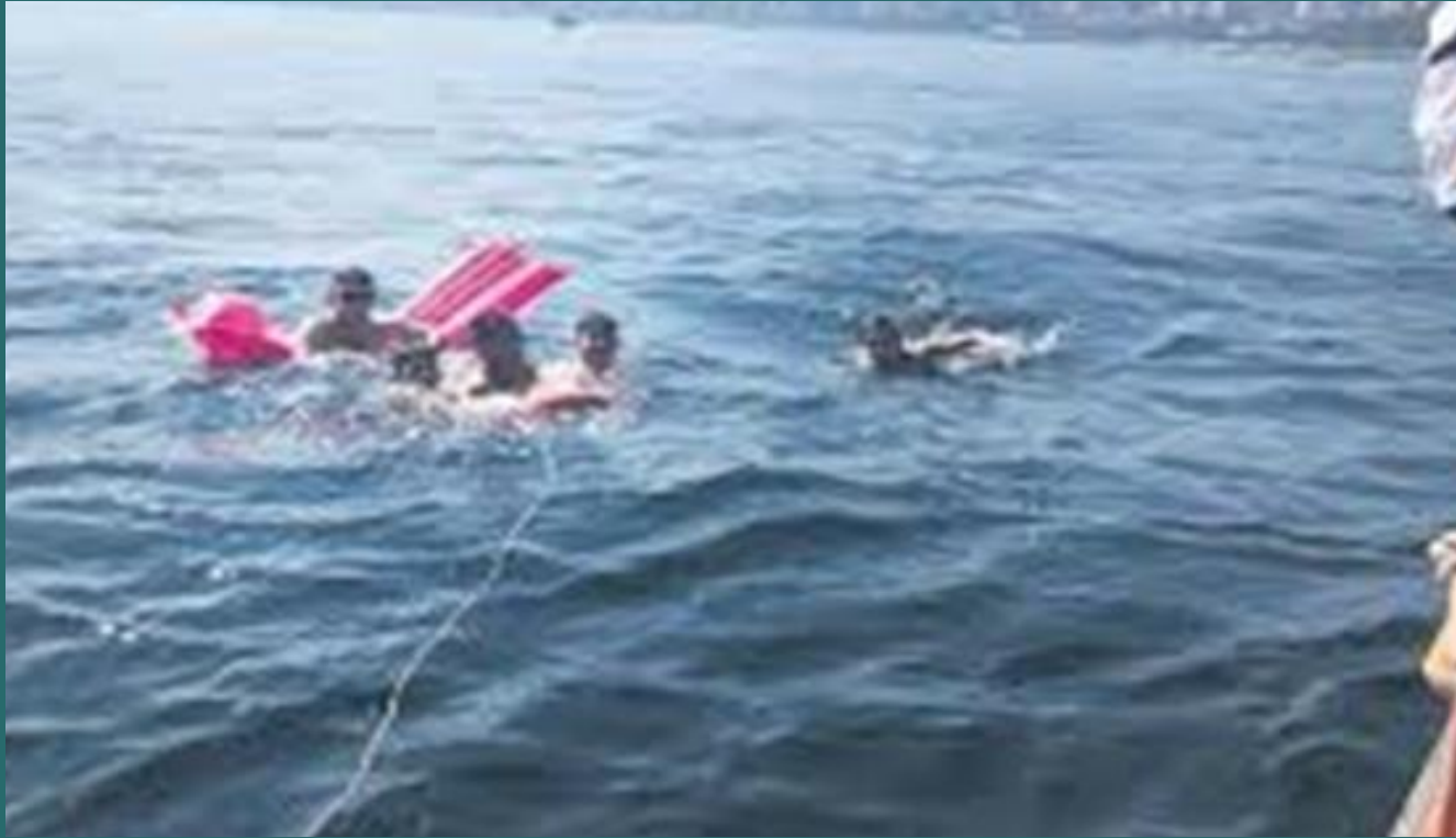
Çok açılan çocukların kurtarılması