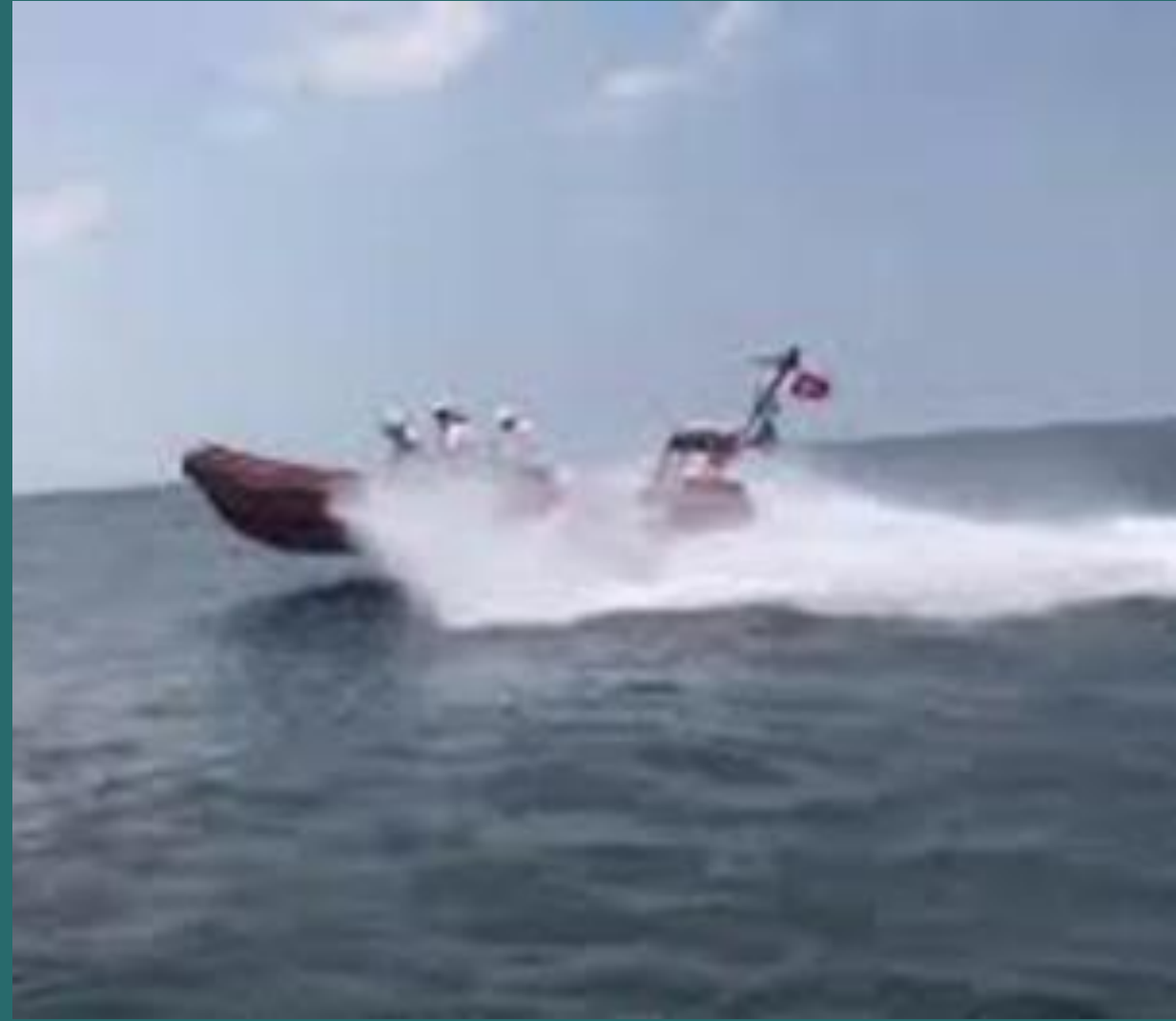
211 Numaralı özel kurtarma botu