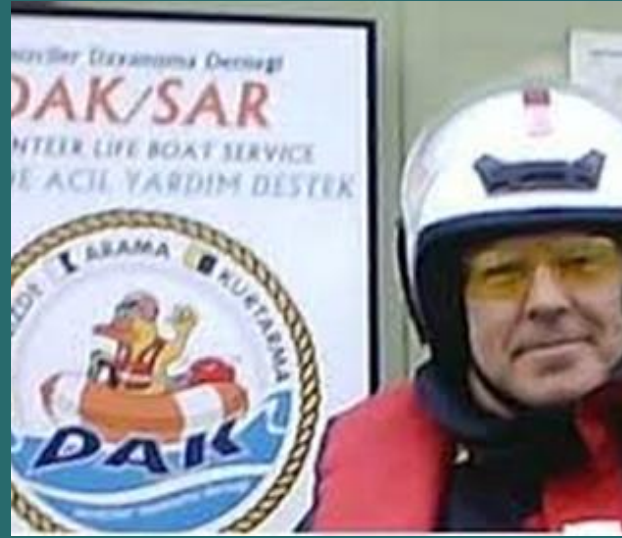
Bir önceki Başkanımız seyir öncesinde