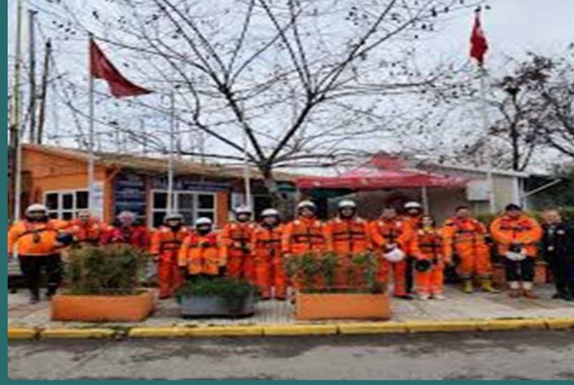
Yeni dönem adayları