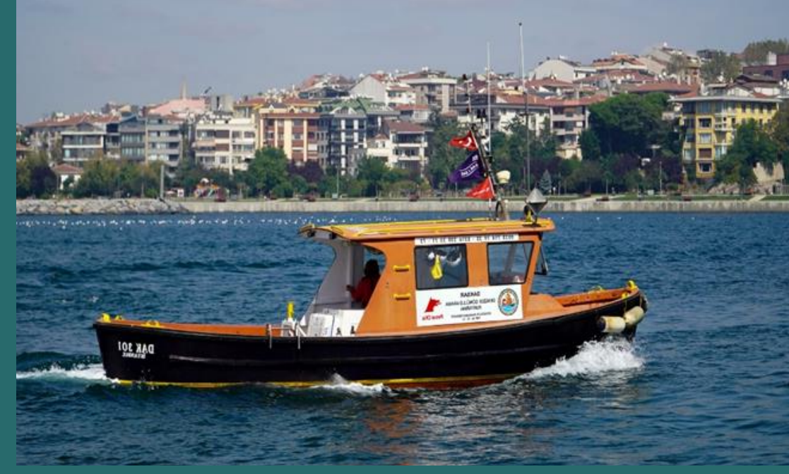
301 numaralı yedekleme botu